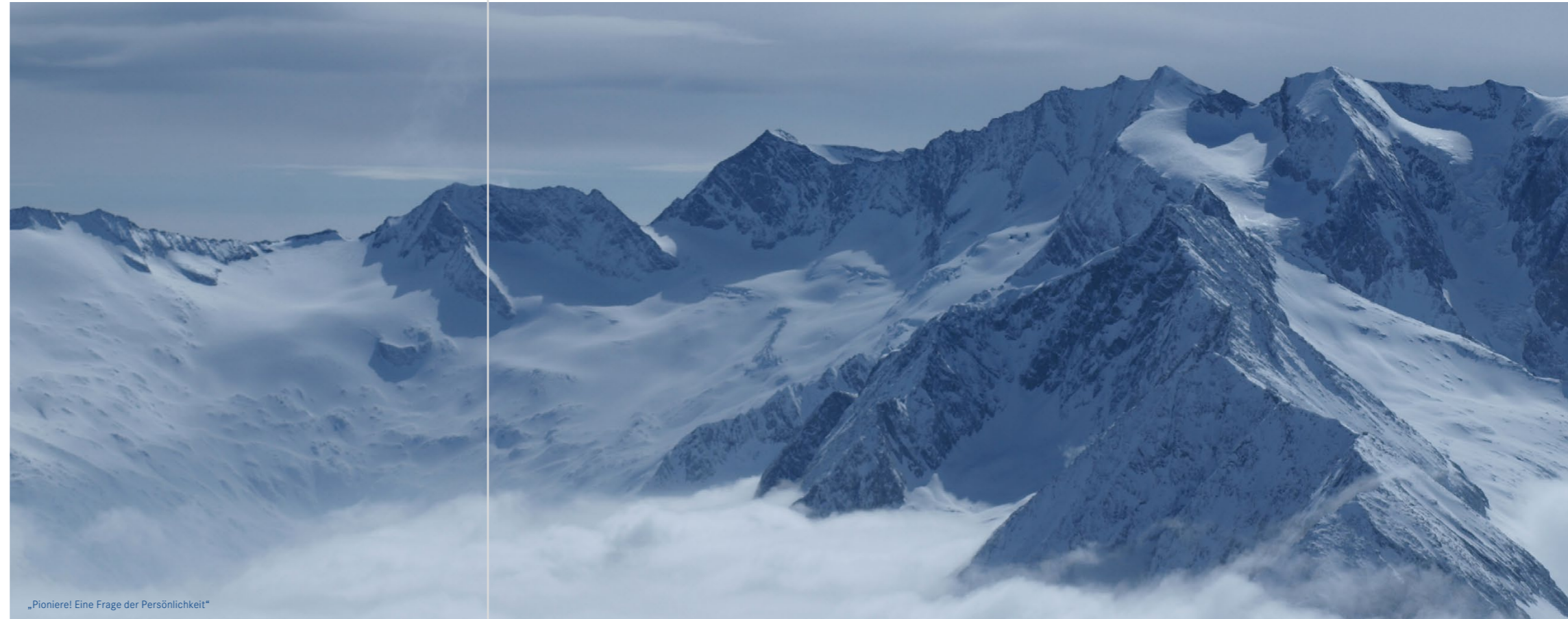
„Pioniere! Eine Frage der Persönlichkeit“

Auf der Suche nach den geforderten Macherqualitäten wird gerne von vergangenem auf zukünftiges Verhalten geschlossen. Aber was tun, wenn es sich um junge, ambitionierte Gesprächspartner handelt, die noch keine entsprechende